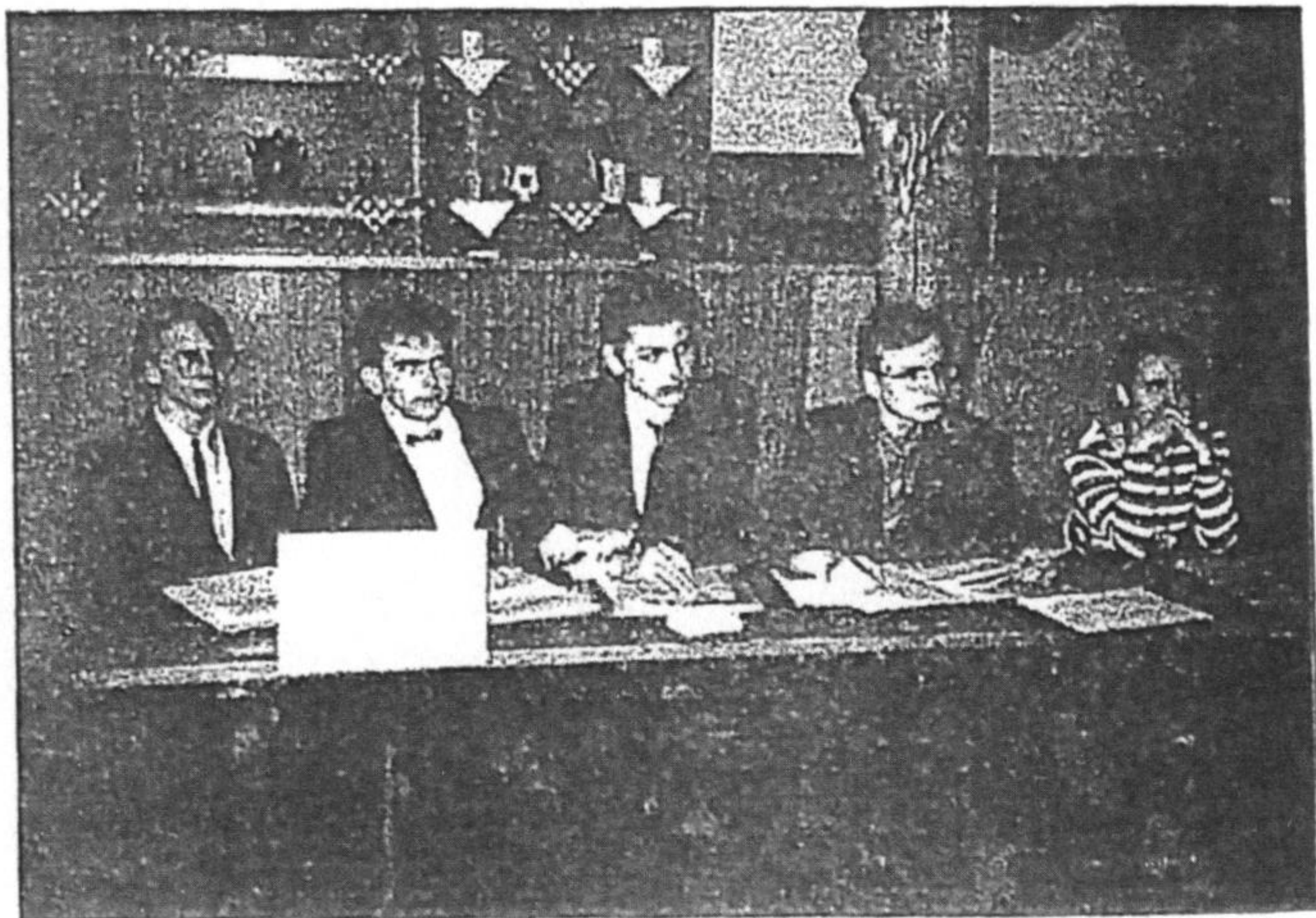
obr. 2: družstvo Gymnázia Pardubice

Po 3 vyřazovacích fyzbojích postoupilo do semifinále 9 družstev, ze 3 semifinálových fyzbojů jejich vítězové – družstva: Gruzie II, Německo, ČR – do finále. Ve finále pak bylo pořadí: 1. ČR, 2. Německo, 3. Gruzie II. Následující pořadí družstev: Maďarsko, Rusko – Novgorod, Rusko – Moskva, Polsko, Gruzie I, Ukrajina – Kijev, Ukrajina – Oděsa, Bělorusko, Uzbekistán, Arménie.